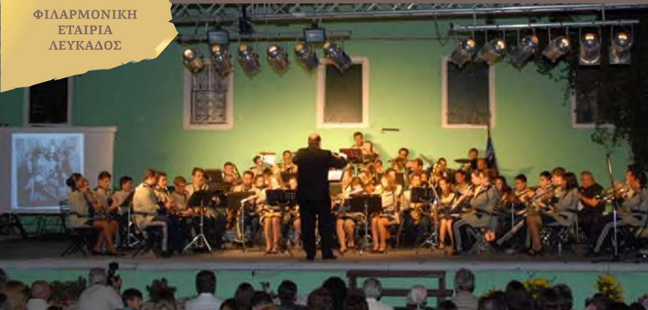
Αφιέρωμα στο Πάνθεον, Κηποθέατρο Αύγουστος 2009