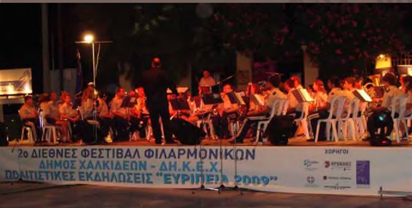
Συναυλία στη Χαλκίδα. Σεπτέμβριος 2009