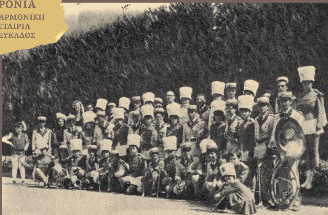
Η Φιλαρμονική στο Saint Dié της Γαλλίας