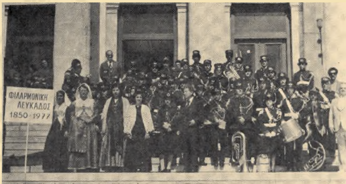
Η Φιλαρμονική Λευκάδος στο Δημοτικό Θέατρο Πειραιώς στις 24 Απριλίου 1977.