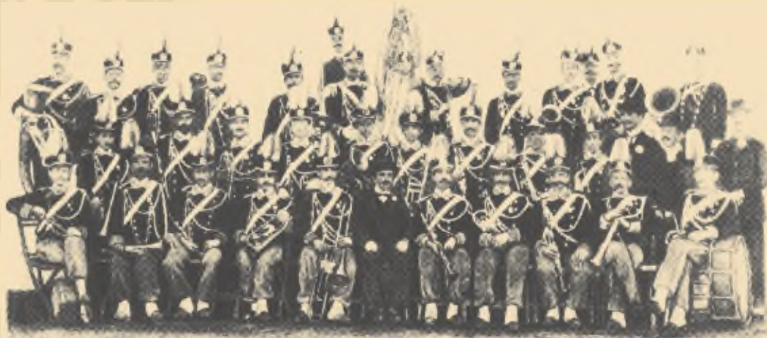
φιλαρμονική Έταιρεία Λευιάδος

Με κινητήρια δύναμη το πάθος της καλλιτεχνικής δημιουργίας και προσφοράς και με φύλακα άγγελό της την αγάπη των Λευκαδιτών, η Φ.Ε.Λ. άντεξε όλες τις δυσκολίες που παρουσίασε η δίνη του χρόνου και βγήκε αλώβητη και περήφανη στις απαιτήσεις του σήμερα.