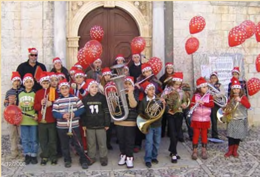
Κάλαντα, Μπαντίνα, Δεκέμβριος 2008