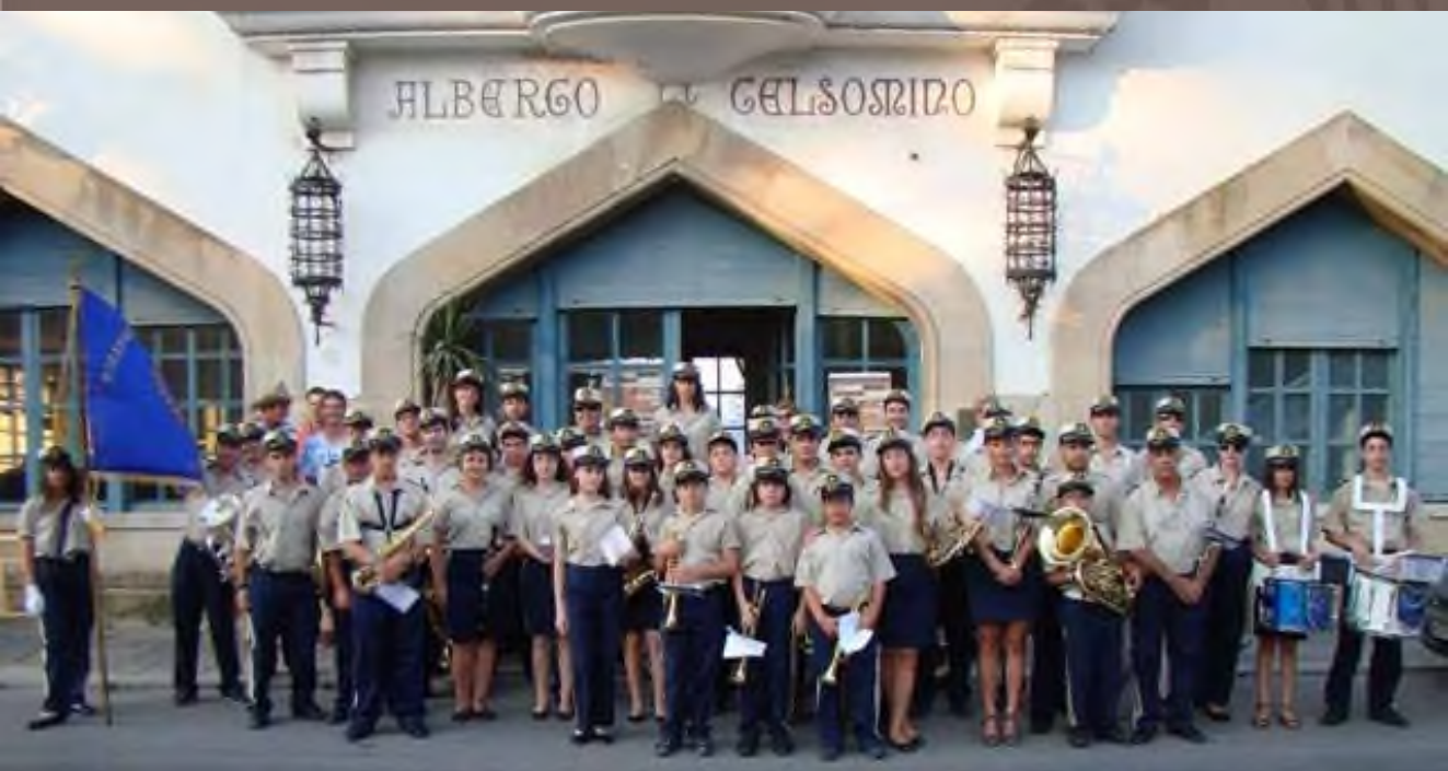
Κως, Ιούλιος 2010