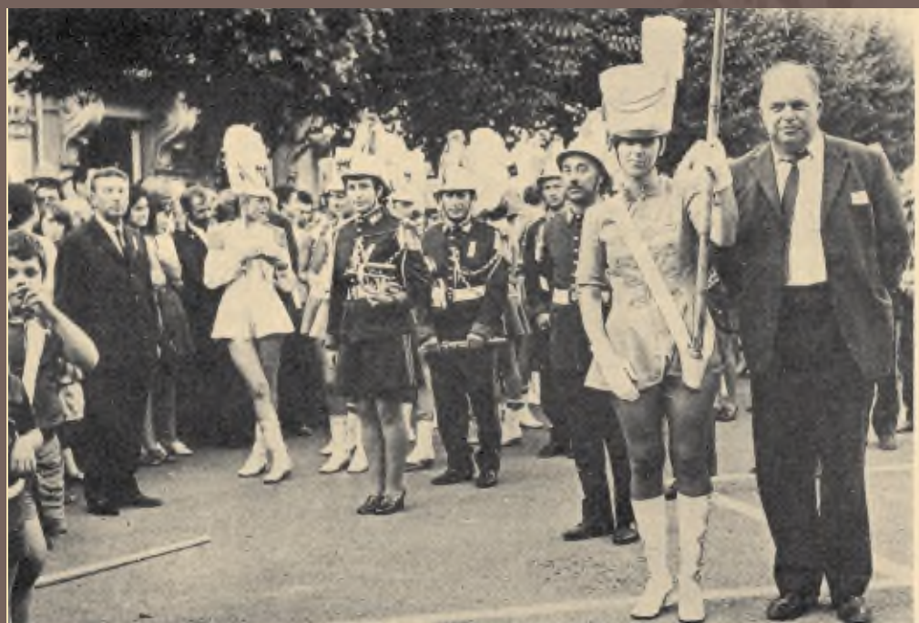
Η Φιλαρμονική στο Λουξεμβούργο