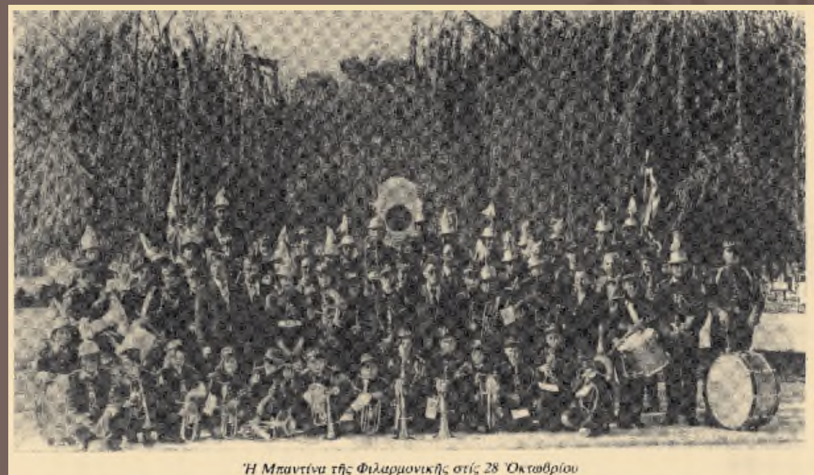
Η Μπαντίνα της Φιλαρμονικής στις 28 Οκτωβρίου