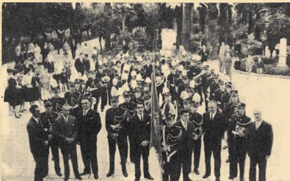
Η Φιλαρμονική στο Ήριον Μεσολογγίου