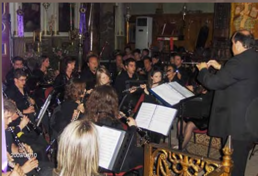
Συναυλία στη Μητρόπολη, Απρίλιος 2009