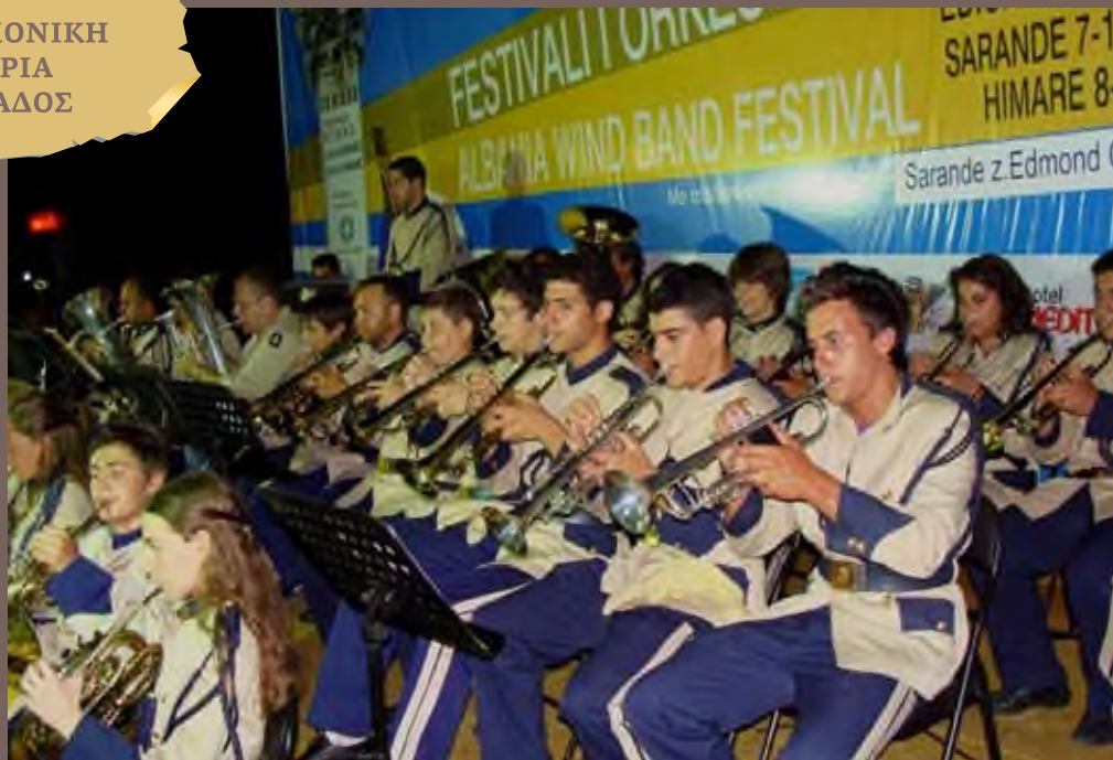
Αλβανία - Χειμάρα, Ιούλιος 2009