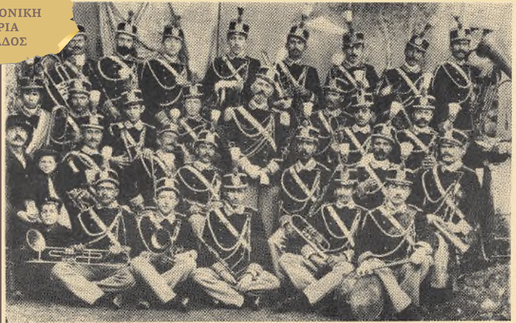
Η Φιλαρμονική το 1902