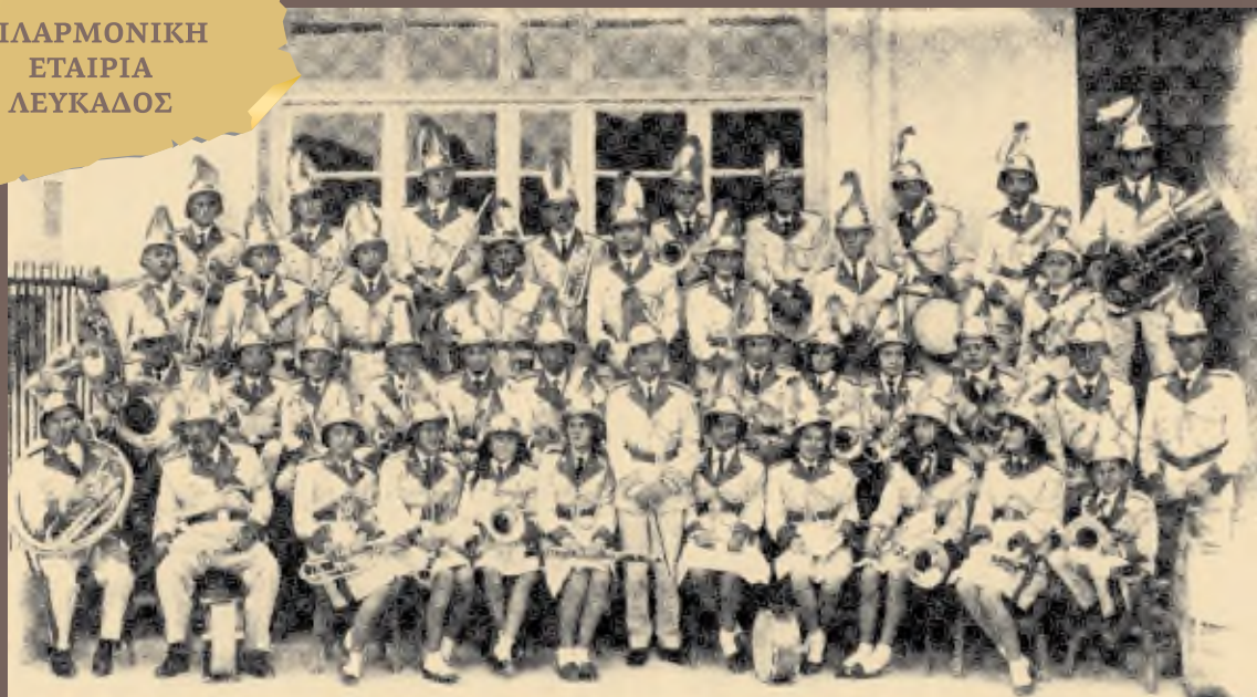
Η Φιλαρμονική με τις θερινές στολές