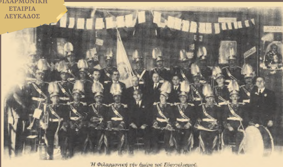
Η Φιλαρμονική την ημέρα του Ευαγγελισμού.