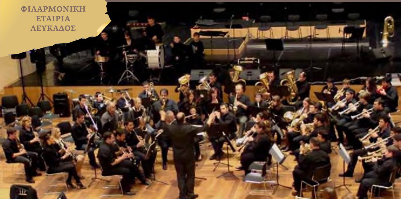
Μέγαρο Μουσικής, Νοέμβριος 2009