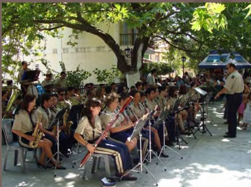
Συναυλία στην Καρνά, Αύγουστος 2009