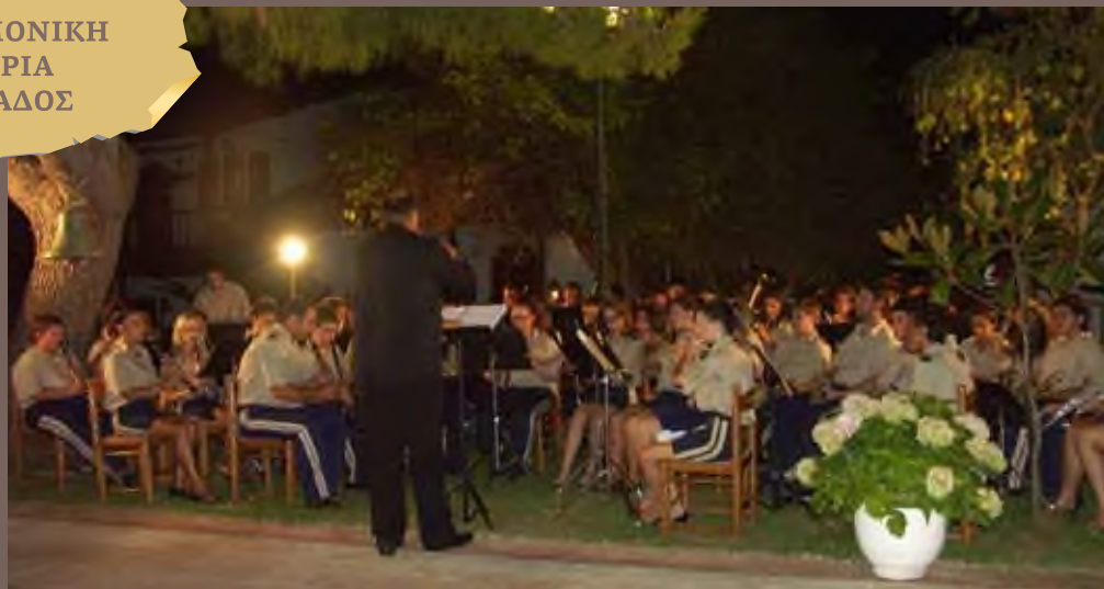
Συναυλία στην Φανερωμένη, Ιούλιος 2009