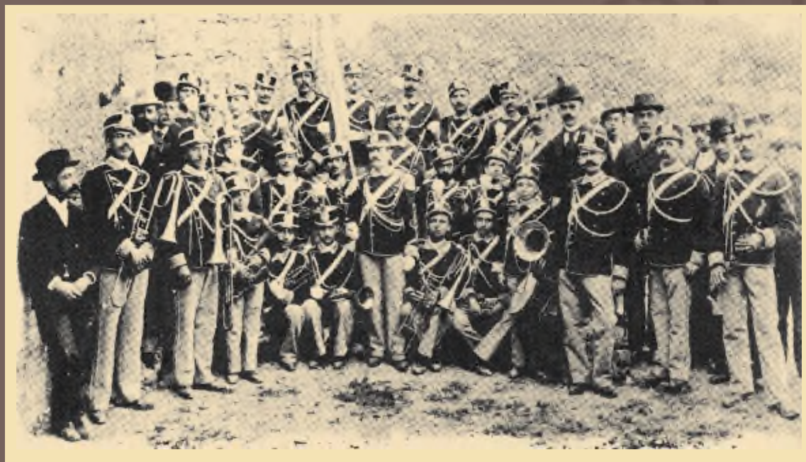
Η Φιλαρμονική με τις στολές του Γολέμη