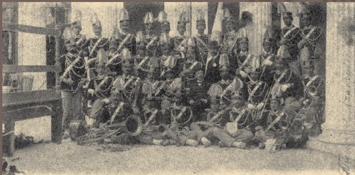
Ἡ Φιλαρμονική στά Προπύλαια τοῦ Ζακκείου, τό 1906