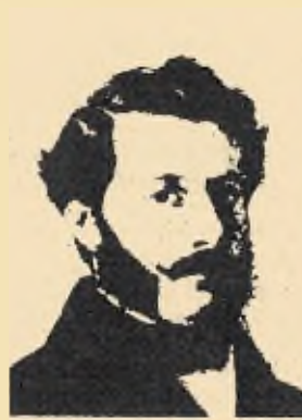
Άριστοτέλης Βαλαωρίτης, έθνικός ποιητής

Οι άνθρωποι που εμπνεύστηκαν και πραγματοποίησαν την ίδρυση του ιστορικού αυτού σωματείου ήταν: