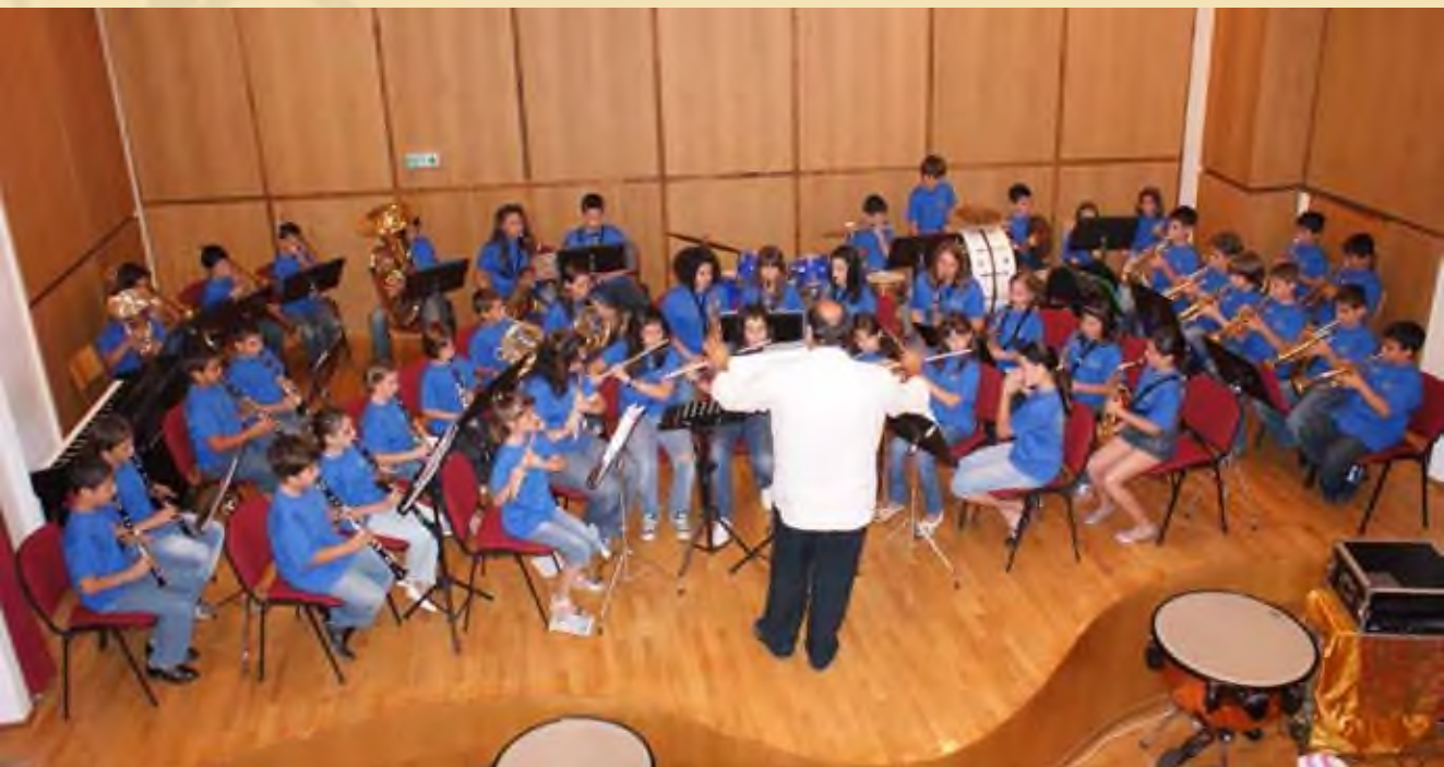
Μπαντίνα, Ιούνιος 2010